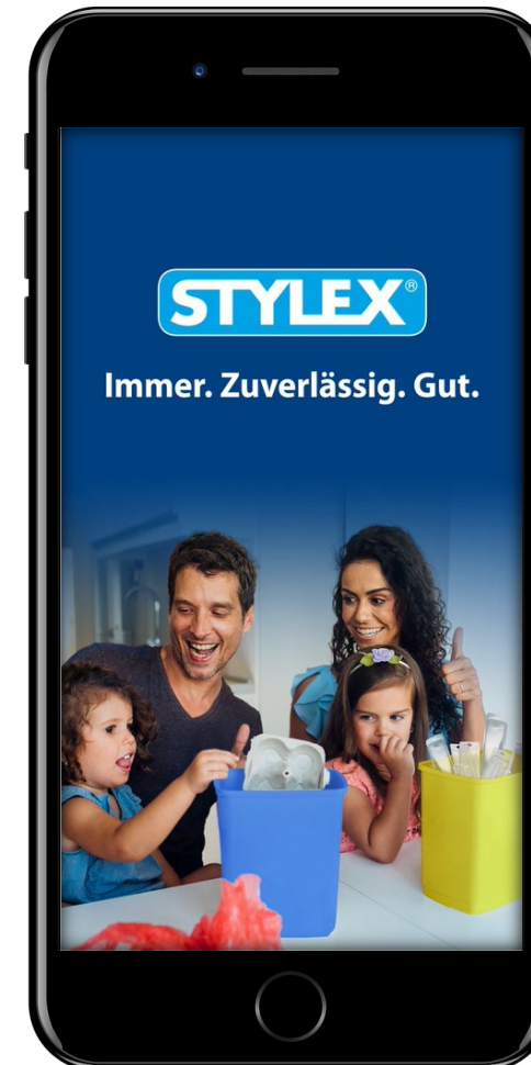
Individualisierter Erklärfilm STYLEX. Zum Abspielen anklicken.

Bei Interesse kontaktieren Sie uns gerne für mehr Informationen unter film@trenn-hinweis.de .